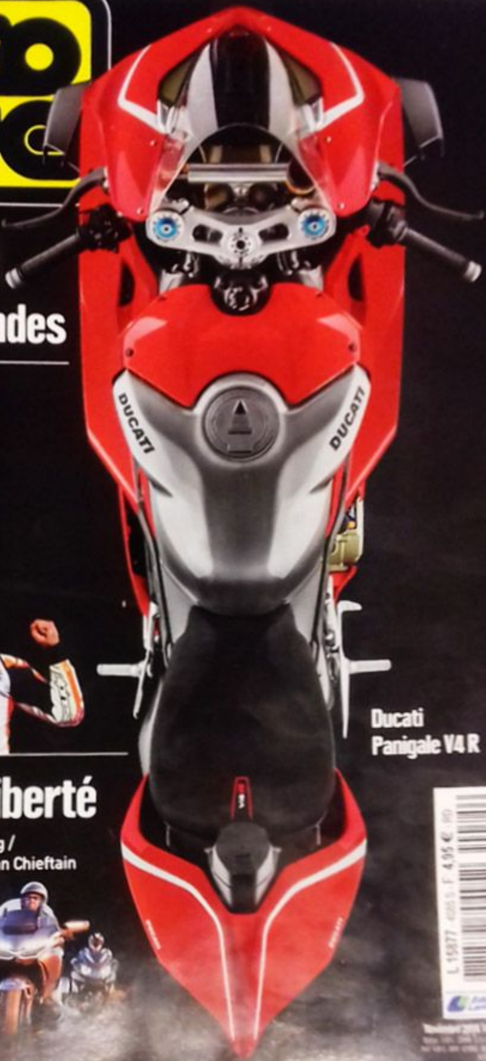
Ducati Panigale V4 R